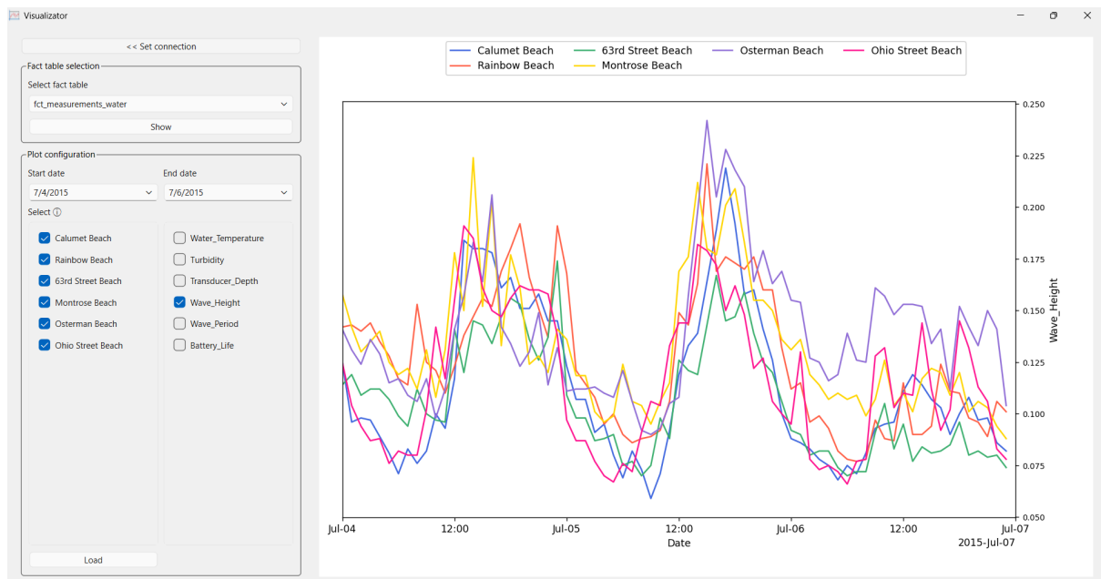
Main window s vizualizáciou typu viacero senzorov a jedna metrika